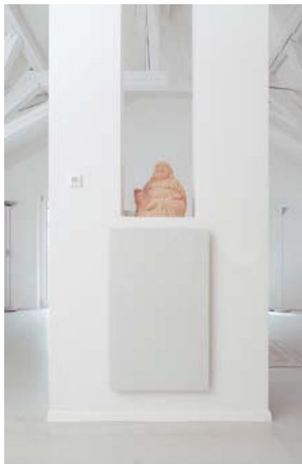
Infrarotpaneele fügen sich in jede Umgebung ein.