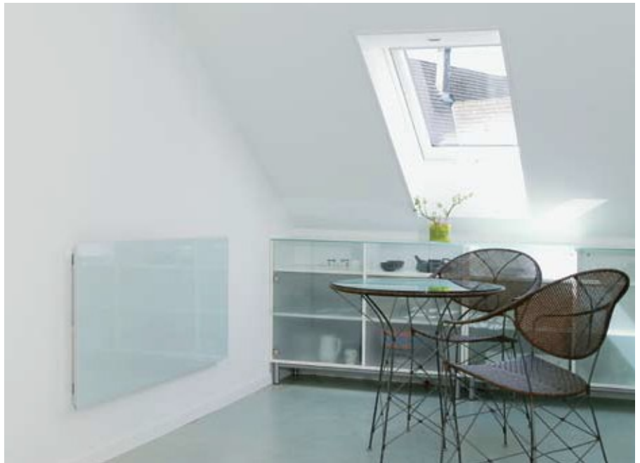
Die Grösse und Leistungsfähigkeit der Infrarotpaneele werden auf Grund der Kubatur und Bausubstanz berechnet.

Die Energieauswertungen der letzten Jahre von diversen Alt- und Neubauten zeigen, dass Infrarot-Heizsysteme einen absolut tiefen Energieverbrauch haben. Der Verbrauch ist so minim, dass die Vorschriften des neuen Energiegesetzes von 4,8 Liter Öl pro EBF für Altbauten unterschritten werden. Erstaunlich ist, dass auch die Energie-sünden bei Altbauten namhaft reduziert werden können.