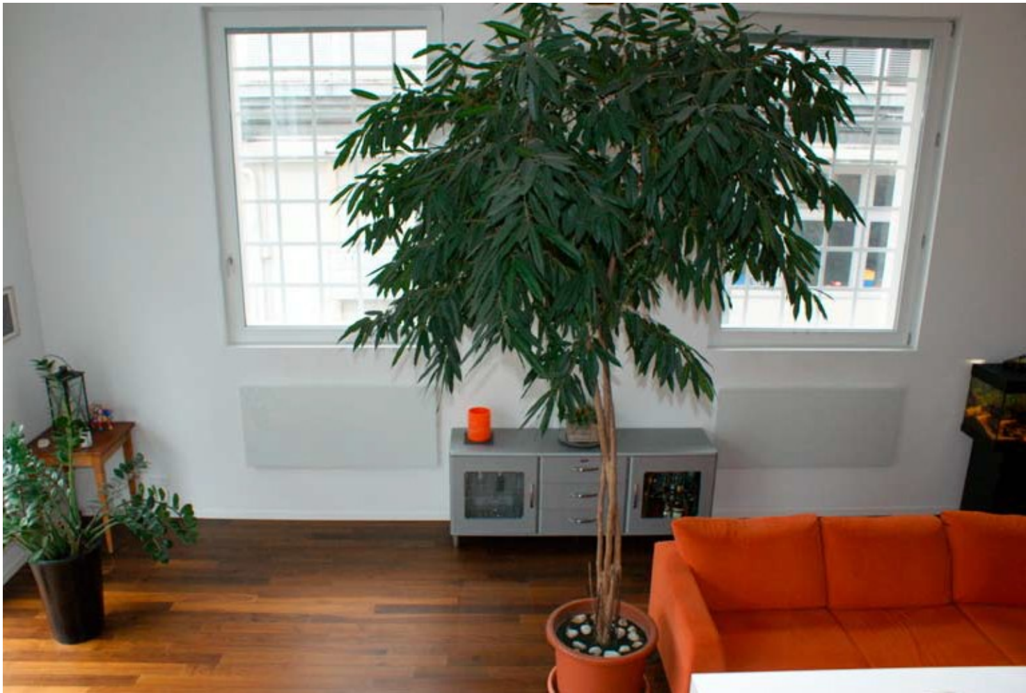
Die Loftwohnung Zentrum Hefi verbraucht minimale Energie trotz 4,5 Meter Zimmerhöhe.